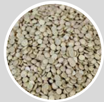
Afesol 2-5 mm